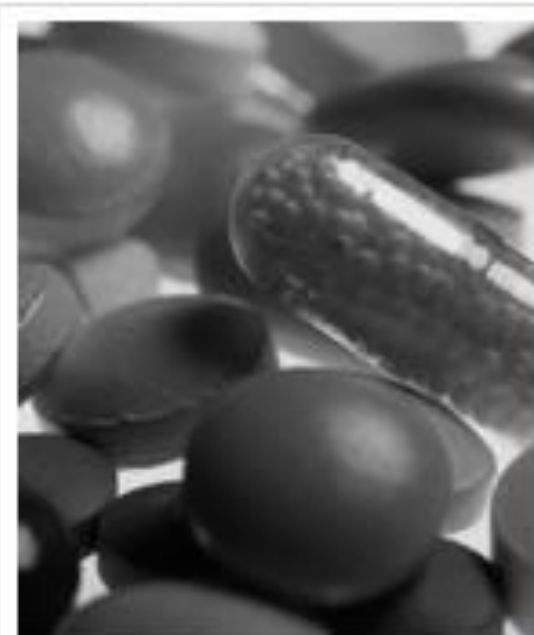
Opioides et mode de vie