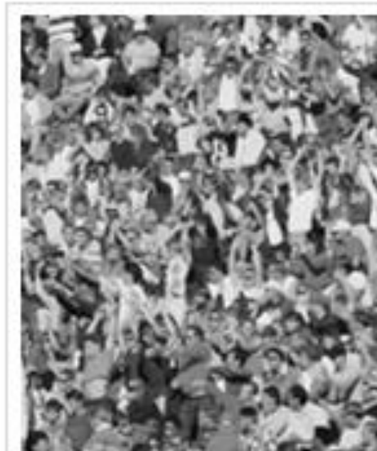
Impacts de la pandémie