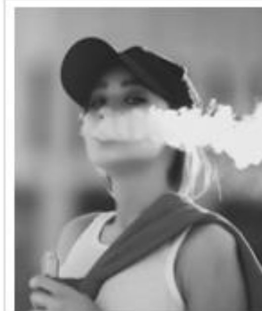
Tabagisme et nouvelles passerelles