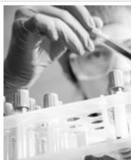
Évolution du cancer